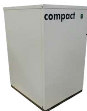
Sécheur de refroidissement