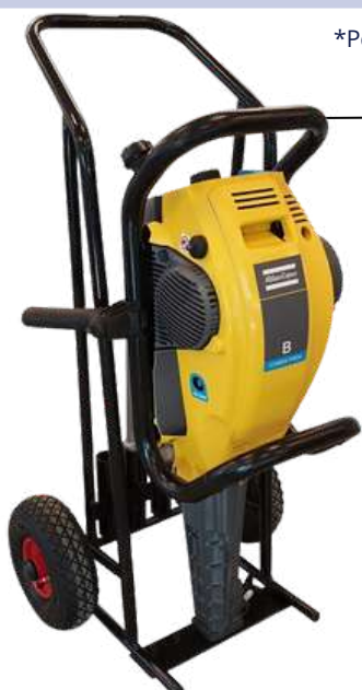
Cobra sur statif

*Pour plus d'informations sur les prix, veuillez consulter les conditions aux pages 36 et 37.