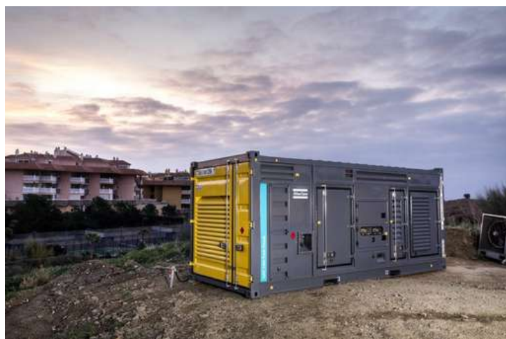
1450 kVA Twin Power

*Pour plus d'informations sur les prix, veuillez consulter les conditions aux pages 36 et 37.